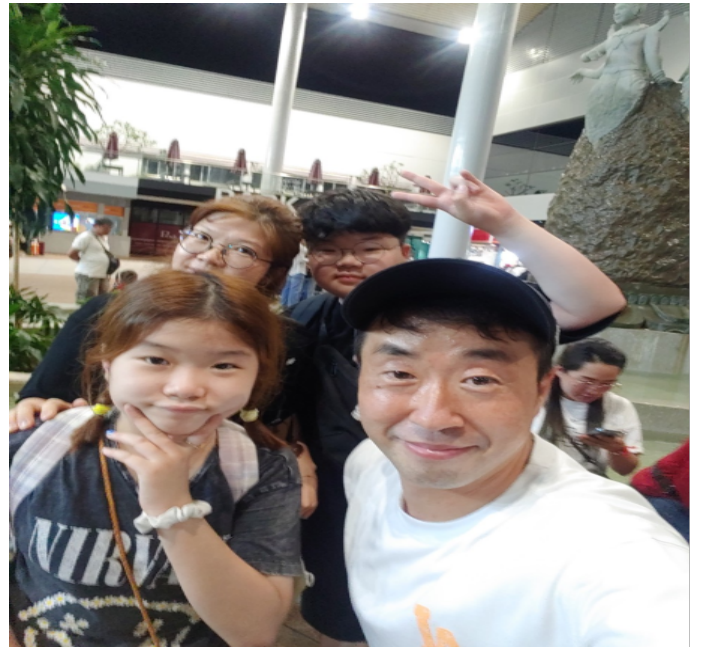
1년 4개월만에 캄보디아 프놈펜 국제공항에서