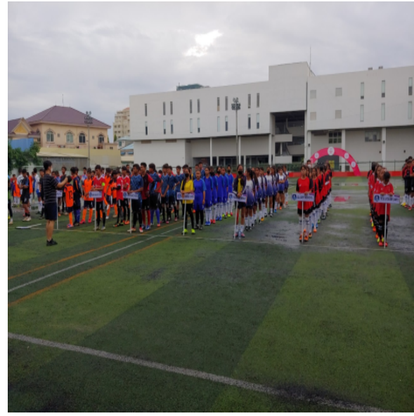
호산나 축구대회가 개최되어 스템으로 섬기다