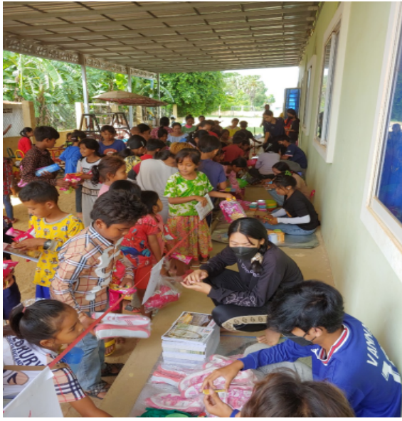
달란트 잔치하는 교회에 방문하다