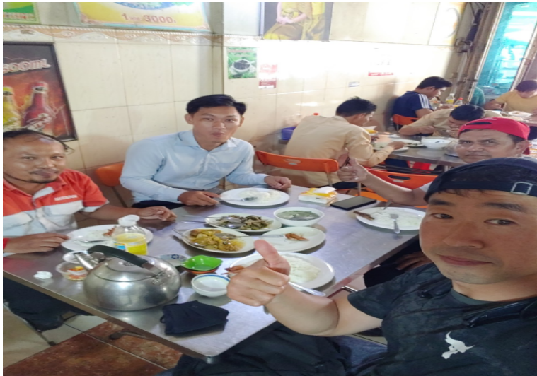
공장 직원들과 함께 한 식사와 교제의 시간들

"សូមព្រះប្រទានព័រ" ސޮބްލެއ៉ាބްލެއ៉ា ប៉េ (주님의 이름으로 축복합니다)