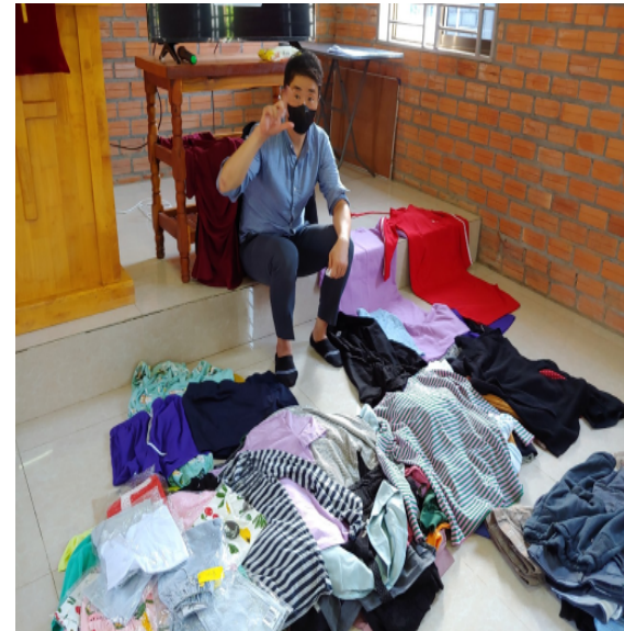
헌 옷으로 바자회 하는 교회에 방문하다