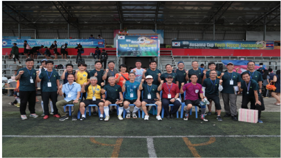
많은 도움과 가르침을 주시는 선배 선교사님들과 함께