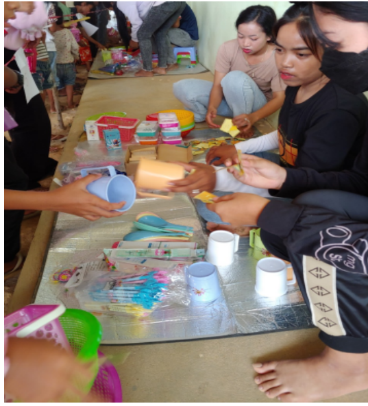
달란트 잔치에서 가장 인기 있는 생필품들