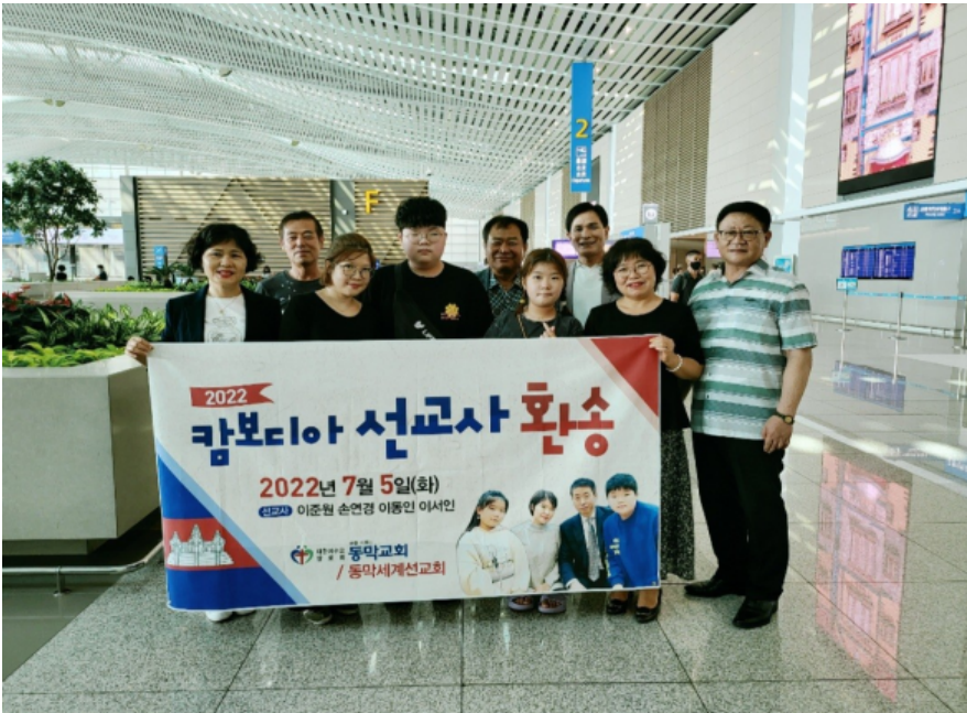
가족들을 환송해주신 동막세계선교회 성도님들

"우리가 알거니와 하나님을 사랑하는 자 곧 그의 뜻대로 부르심을 입은 자들에게는 모든 것이 합력하여 선을 이루느니라" (롬8:28)